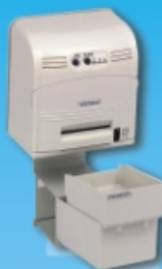
可隨車使用亦可壁掛